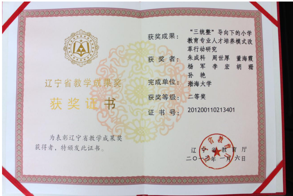
图3 辽宁省教学成果奖 获奖证书