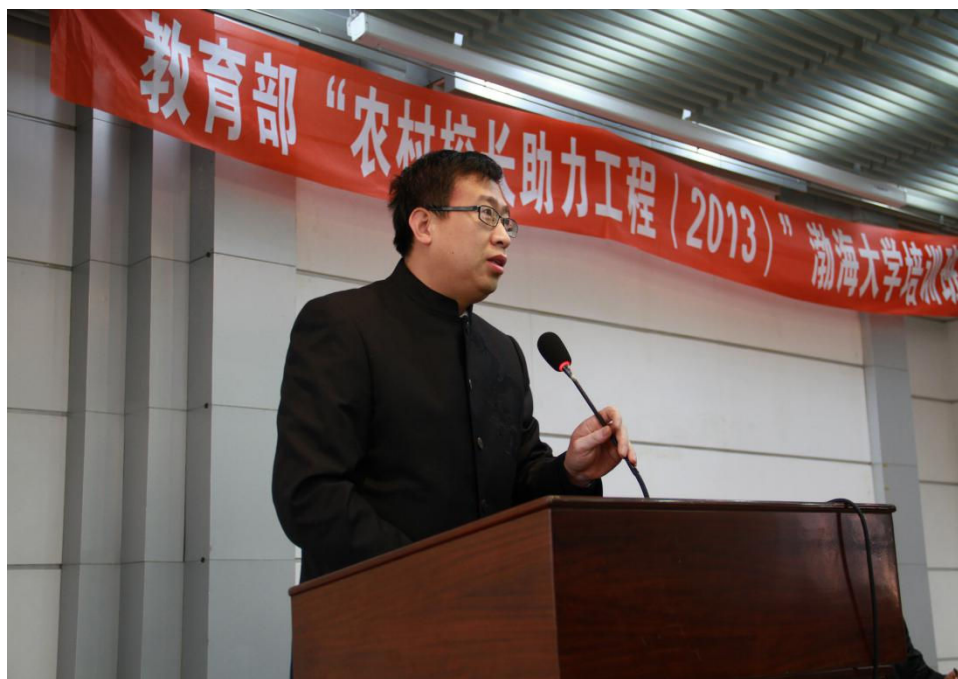
图1 朱成科教授在教育部“农村校长助力工程”培训班上做报告